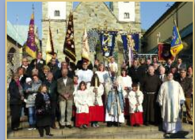
Werl - Wallfahrer im Februar 2014

anschließend Möglichkeit zur Teilnahme am gemeinsamen Kaffeetrinken am Marktplatz in Werl