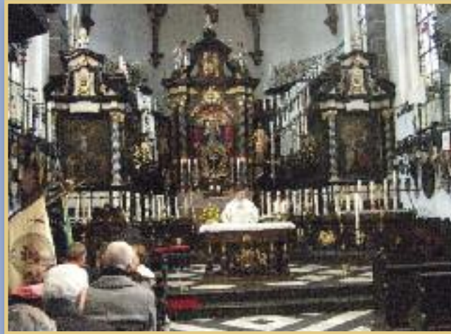
Wallfahrt 2014 in Kevelaer (Kerzenkapelle)

anschließend Möglichkeit zur Teilnahme am gemeinsamen Kaffeetrinken im Café „Goldener Apfel“ der Kerzenkapelle gegenüber