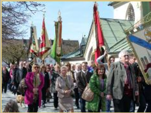
Altöttingwallfahrt im März 2014

anschl. Möglichkeit zur Teilnahme am gemeinsamen Kaffeetrinken im Hotel "Zur Post", Kapellplatz 2, in Altötting