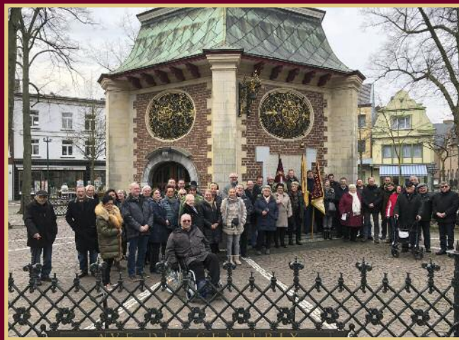
Wallfahrt 2018 in Kevelaer Wallfahrtsgruppe vor der Gnadencapelle in Kevelaer

anschließend Möglichkeit zur Teilnahme am gemeinsamen Kaffeetrinken im „Café Hemmer“ am Marktplatz in Werl