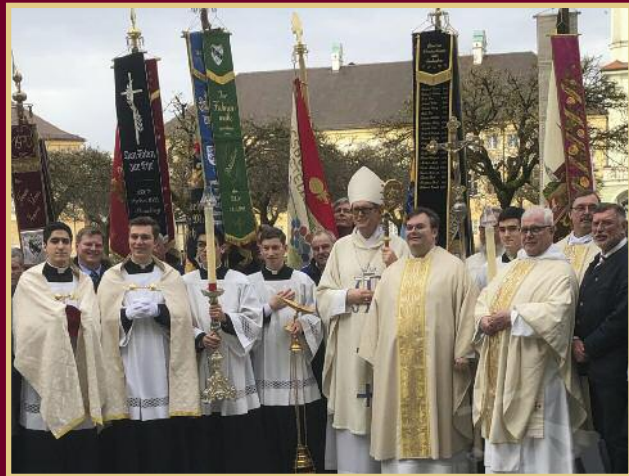
Altöttingwallfahrt im März 2018 mit Weibischof Dr. Josef Graf, Bistum Regensburg

anschl. Möglichkeit zur Teilnahme am gemeinsamen Kaffeetrinken im Hotel "Zur Post", Kapellplatz 2, in Altötting