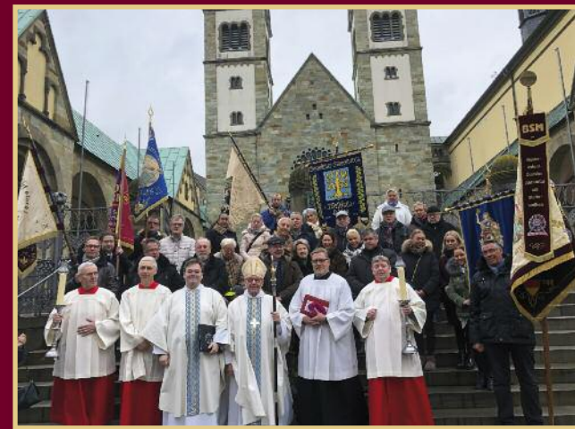
Werl - Wallfahrt im Februar 2018 Werler Pilger mit Weihbischof Dieter Geerlings aus Münster

anschließend Möglichkeit zur Teilnahme am gemeinsamen Kaffeetrinken im Café „Goldener Apfel“, der Kerzenkapelle gegenüber